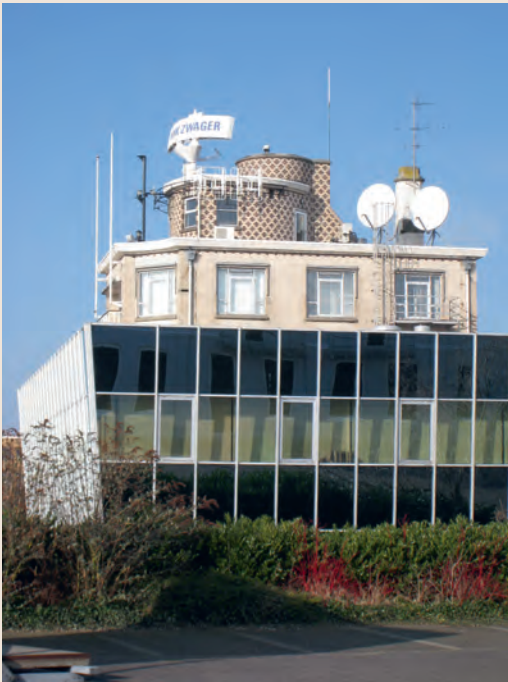
▲ Luchtwachtpost 5E3 Maassluis op het gebouw van Koninklijke Scheepsagentuur Dirkzwager torent boven de radarpost uit die de scheepsbewegingen op de Nieuwe Waterweg in de gaten hield. Het gebouw inclusief de luchtwachtpost is ontworpen door architect Bastiaan van der Lecq. Op de voorgrond de aanbouw uit 1993.