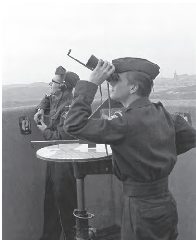
▲ Luchtwachters in actie met het luchtwachtinstrument op luchtwachtpost 4S2 Egmond aan Zee eind jaren 1950. Deze verdwenen post was op een bunker gebouwd.

zijn er achttien posten op molenrompen ingericht. Er staan er nu nog zeven van overeind, waaronder de Molen van Sloot in Keijenborg, de Kwaksmölle in Varsseveld, de Korenmolen in Etten-Leur en de Rielse Molen in Riel (Van Lochem-van der Wel, 2016a).