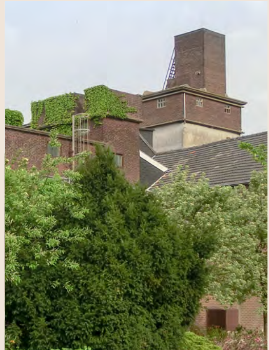
▲ Uniek zijn de twee generaties luchtwachtposten 8K3 op de moutfabriek van firma Jos-Hendrickx-Crijns in Swalmen, nu Malt Cargill. Links met kooiladder de oudste post uit 1952, rechts de in 1956 gebouwde post op de nieuwe, hogere silo.