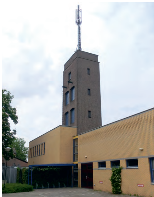
▲ Luchtwachtpost 8G3 Gemert was bovenop de slangdroogtoren van de in 1953 gebouwde brandweergarage. Op de rand van de post staan nog de geschilderde windrichtingen en klokuren voor de luchtwachters. Op de voorgrond de uitbreiding van de kazerne uit 2000.

naar van de gemeente en een raadgevend architect constateren dat op zeer korte termijn maatregelen moeten worden getroffen om instorting van een gedeelte van het gebouw te voorkomen. De bouw van de luchtwachtpost heeft in elk geval [extra] schade veroorzaakt aan ons slecht gebouwde klooster, schrijven de zusters aan de burgemeester die ze om hulp vragen. De heren zijn vóór het betrekken van ons dak telkens gewaarschuwd ten aanzien van de zwakke bouw van het klooster. 5 Ze verzoeken het KLD om de luchtwachtpost van het dak te verwijderen. De situatie van het klooster is dusdanig dat het KLD snel besluit de post te verplaatsen naar een nieuw te bouwen betonnen luchtwachtoren een kilometer zuidelijker buiten de bebouwde kom. Een enkele flat, winkel, hotel, café of woonhuis met een geschikt dak is gebruikt om er een luchtwachtpost op te plaatsen. Voormalig station Gouwsluis in Alphen aan den Rijn, waar sinds 1935 geen