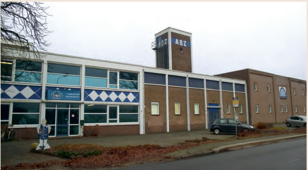
▼ De bouw van luchtwachtpost 7S3 in Anloo lifte mee met de herbouw van de coöperatieve zuivelfabriek in 1953. De post zit op het waterreservoir. De trap buitenom is vernieuwd. Sinds 1973 is de fabriek in gebruik bij vleesgroothandel ABZ.