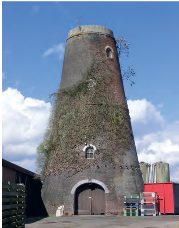
▲ Het verleden als luchtwachtpost (3P3) is goed herkenbaar aan de afwijkende gemetselde en met cement afgesmeerde borstwering op de romp van De Korenmolen in Etten-Leur. Het KLD bracht een stevige waterdichte betonnen vloer op het uitkijkplatform aan. De molen is nu in gebruik voor opslag.

op de watertoren van farmaceutisch bedrijf Organon in Oss en in 1952 op watertoren de Steenen Tafel in Arnhem. Onder het uitkijkplateau op de Steenen Tafel had het Provinciaal Commando van de Bescherming Bevolking een ontvangst- en zendstation voor de coördinatie van de civiele verdediging en hulpverlening in geval van een atoomaanval. Zij ontvingen overigens geen rechtstreekse meldingen van de luchtwachtpost. Alle coördinatie liep via het regionale luchtwachtcentrum waaraan de luchtwachters hun verdachte vliegtuigwaarnemingen meldden.