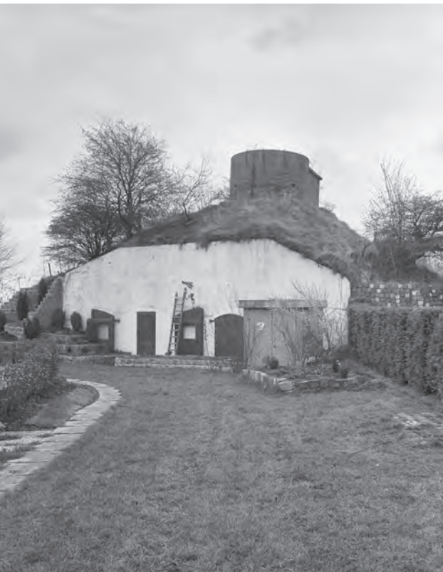
▲ Luchtwachtpost 5J3 Ooltgensplaat in 1980. De halfronde bakstenen post in sleutelgatvorm is in 1953 gebouwd op een remise op fort Prins Frederik. De post is nog aanwezig.