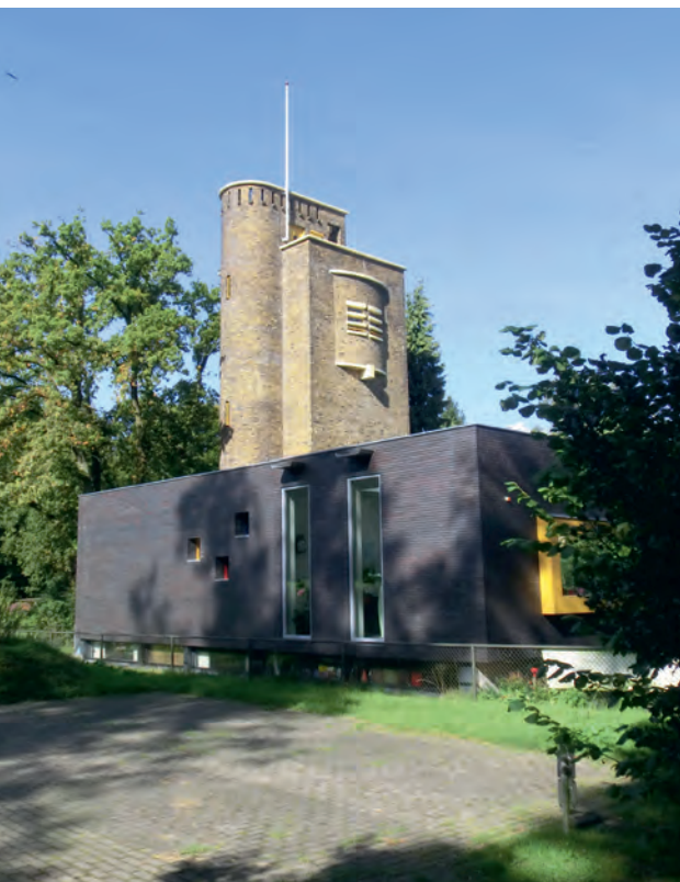
▲ Voor luchtwachtpost 2Q1 op de watertoren in Doorwerth hoefde het KLD in 1952 alleen een telefoonleiding aan te leggen om het al bestaande uitkijkplateau geschikt te maken voor luchtwachters. In 2010 is de watertoren uitgebreid met een eigentijdse aanbouw en als woning in gebruik genomen.