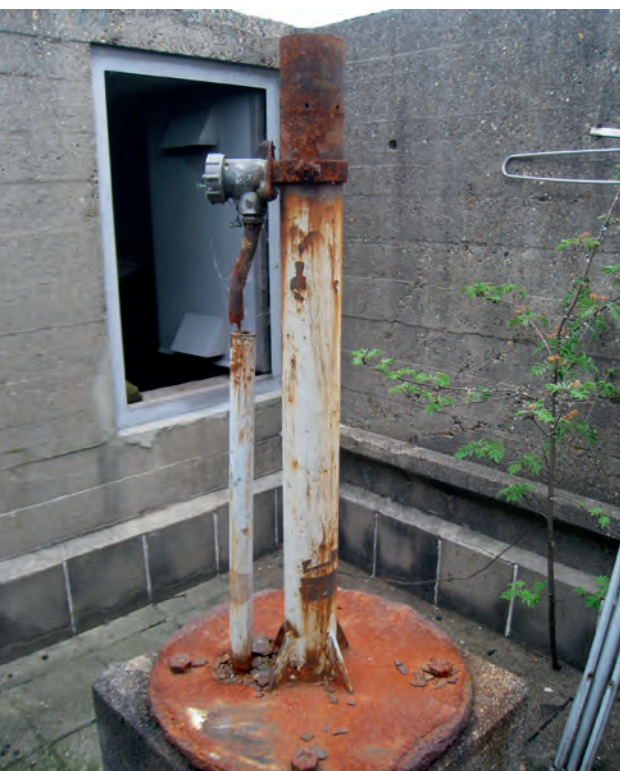
▲ De poot van het luchtwachtinstrument is nog aanwezig op luchtwachtpost 5E2 Delft op de voormalige machinefabriek van RVO-TNO. De post was eerst elders in Delft gepland maar belandde uiteindelijk in Rijswijk. Door de smalle buis liep de telefoonkabel (bron: auteur 2011).