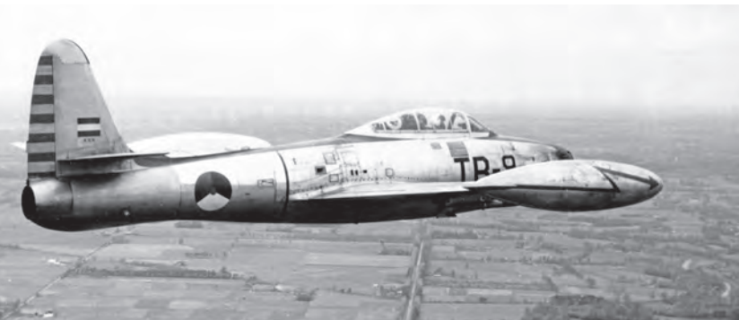
◀ Tijdens oefeningen spotten de luchtwachters vliegtuigen van de Koninklijke Luchtmacht zoals deze jachtbommenwerper Republic F-84G Thunderjet die in 1956 laag boven Brabant vliegt. Het toestel K66/TB-9 was in gebruik bij het op vliegbasis Eindhoven gestationeerde 315 Squadron.

bijvoorbeeld doordat de post geïntegreerd werd in een ontwerp voor nieuwbouw van een pand destijds. Van de vele eenvoudige gemetselde en houten posten op (fabrieks)daken bleef nauwelijks iets bewaard. Een uitzondering vormt de luchtwachtpost bovenop fort Panterden die uit een eenvoudige gemetselde borstwering bestaat en in 2011 is gerestaureerd en opgesteld. Museum fort Panterden herbergt ook een kleine tentoonstelling over het KLD en een replica van het luchtwachtinstrument.